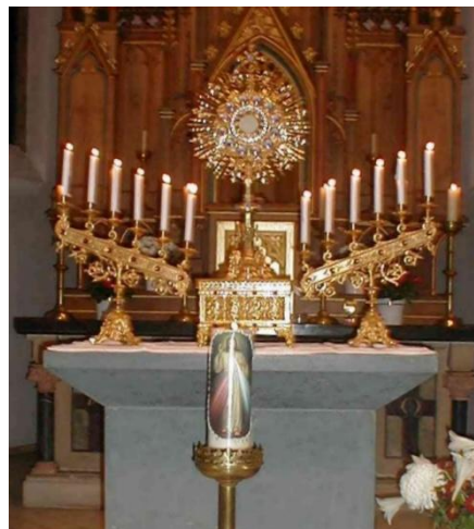
Anbetung am 8.11.2004 in Sievernich

„Unsere Himmelskönigin wird für euch bitten!“